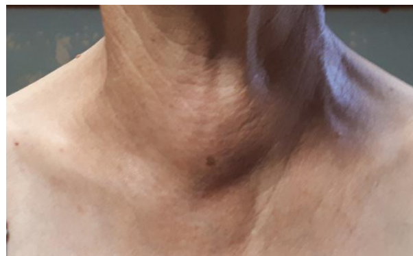
Nódulo tiroideo istmico.

Desde el punto de vista semiológico, se plantea el diagnóstico clínico de nódulo tiroideo ante una tumoración que asienta en la región infrahioidea, que asciende y desciende con la deglución y que se oculta total o parcialmente con la contracción de los músculos infrahioideos (al oponerse a la apertura bucal del paciente). Hablamos de nódulo único o solitario cuando no palpamos otras tumoraciones ni palpamos la glándula tiroides (por definición una tiroides normal no es palpable). Si por el contrario se palpan otros pequeños nódulos o se palpa la glándula aumentada, estamos en presencia de un nódulo prominente o dominante en el contexto de un bocio multinodular.